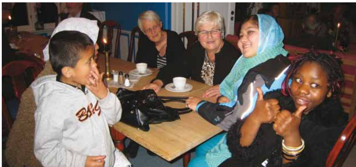
Feiring av FN-dagen i Midt-Gudbrandsdalen.

I en strategi for å nå fylkesplanens mål er det nødvendig å se spesielt på flyktingers og innvandreres kår i det norske samfunnet. Det er et mål for Oppland at samfunnets ulike institusjoner, styrer og råd gjenspeiler det kulturelle mangfoldet. Rask og god bosetting av flyktinger i kommunene vil danne grunnlag for et aktivt liv i trygge omgivelser og bidra til økt samfunnsdeltakelse.