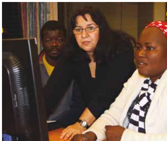
Kurs/verksted for innvandrersorganisasjonene.