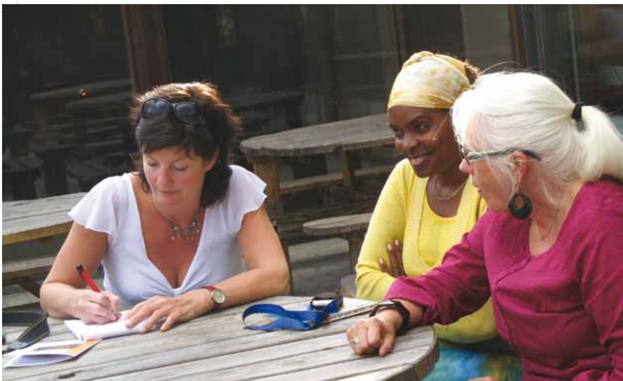
Fra sommeravslutning i prosjekt "Velkommen inn".

Nettverket er basert på frivillighet og er et supplement til andre offentlige tjenester og tilbud.