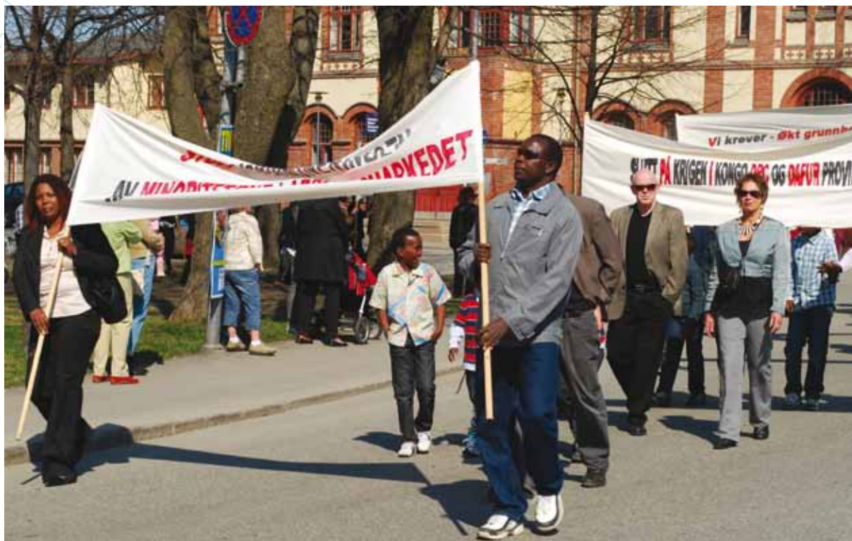
1. mai-tog på Gjøvik.