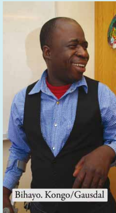
Fra "Nye Opplendinger i arkivet."

Hovedprosjektet skal gå over tre år. Arbeidet startet i september 2008.