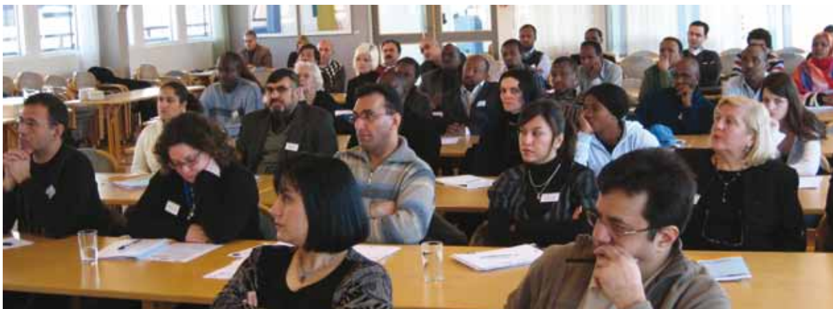
Seminar for innvandererorganisasjoner og innvanderråd i Oppland og Hedmark.

Som et forprosjekt anbefaler arbeidsgruppa at en modell for denne type kurs og samarbeid skal spres til alle kommuner i fylket for å kunne bidra til bedre og raskere integrering. Videre anbefales det at kursene bør implementeres i en mer langsiktig og målrettet politikk for integrering i Oppland. Det foreslås at kostnader ved kursarrangering i hovedsak dekkes av lokale samarbeidsparter og kursavgift for deltakere, mens koordinatorfunksjonen blir fylkeskommunens ansvar og bidrag. Det anslås at behovet for en koordinator tilsvarer en 30-40 % stilling i ett år.